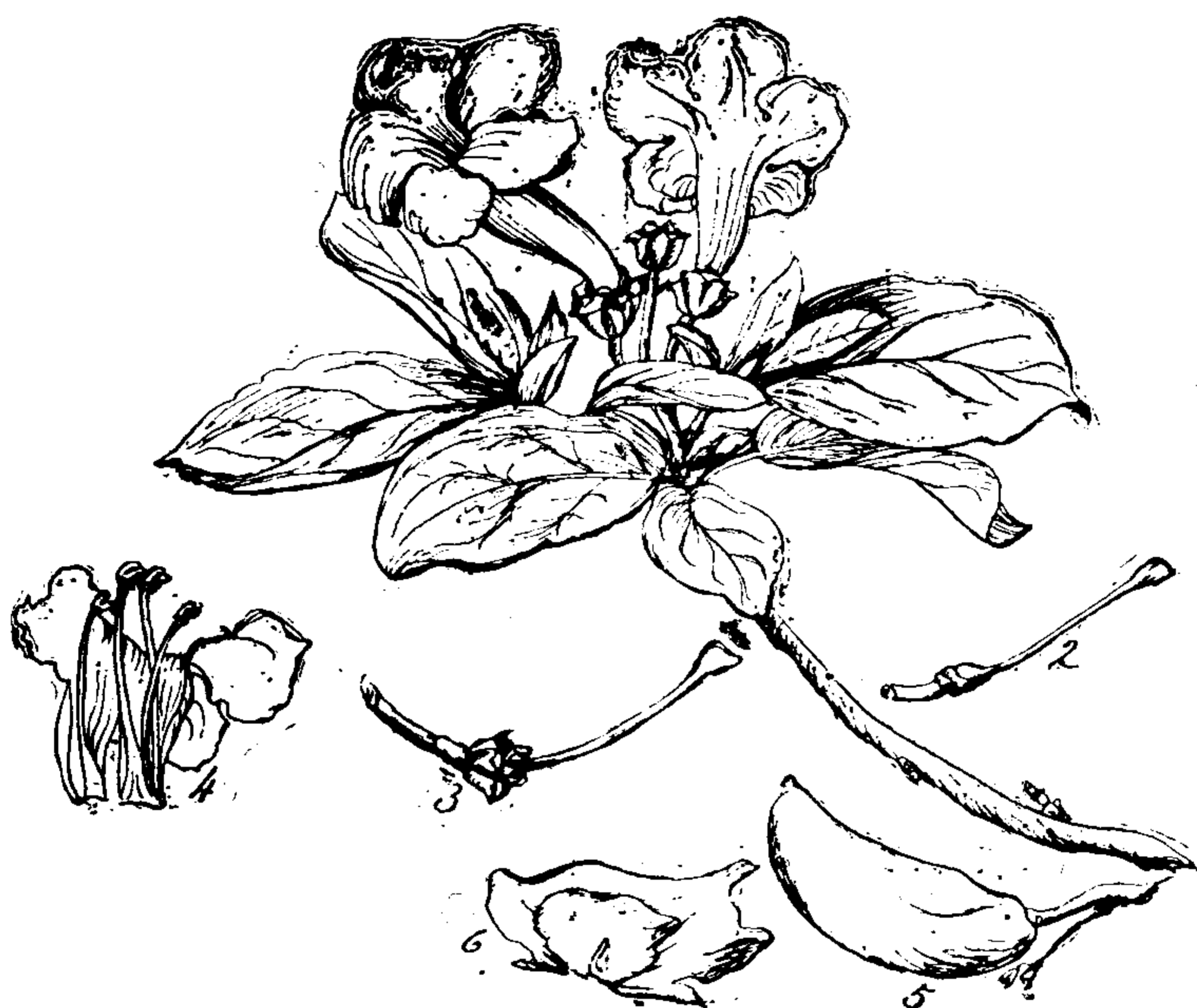
Fig. 12.— Delostoma dentatum roseum , Napanga:— 1. Rama con hojas y flores.—2. Pistilo.—3. Caliz y el pistilo.—4. Estambres.—5. Fruto.—6. Semilla.

La inflorescencia es en racimo simple; el cáliz es gamosépalo con cinco dientes pequeños; la corola campanulada de color rosado, gamosépala, con cinco glóbulos regulares; los estambres en número de cuatro didínamos, los dos mayores alcanzan la altura del estigma; las anteras se adhieren al fila-