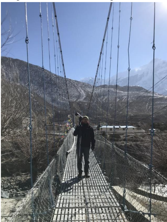
Hängbron var stabilare än vad den ser ut att vara.

rinner en flod och huvuddelen av Jomsom ligger på den ena sidan och på den andra sidan ligger odlingarna. Efter att ha ätit en grötfrukost med rostad macka och kaffe gav vi oss ut i omgivningarna på andra sidan floden. Omgivningarna bestod även här av äppelodlingar med insprängda plättar av grödor för vardagsbehov såsom någon mangoldliknande växt. Vi fick gå över en