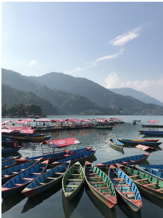
Sjön i Pokhara.

Resdag med buss till Pokhara. Satt tillbakalutade i sätet och kollade hur det såg ut utanför där vi passerade. Kom fram någon timma innan skymningen. Staden är vackert belägen vid en stor sjö och har en lugn puls, inte alls alla människor och trafik såsom i Kathmandu. Vi tog en promenad längs strandpromenaden vid sjön och njöt av miljön.