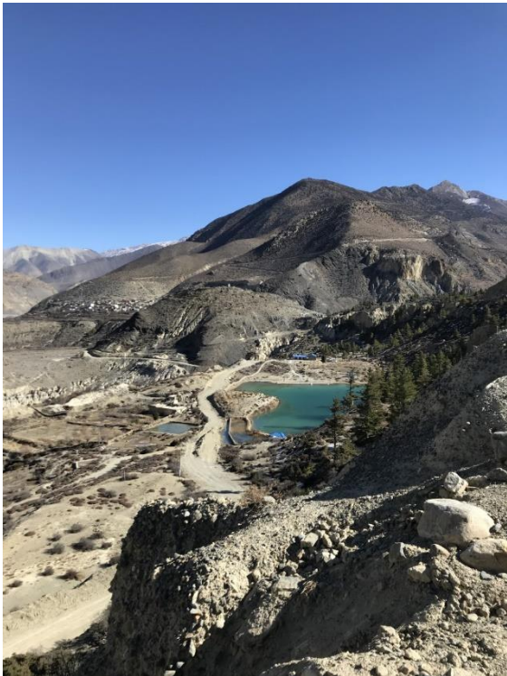
Dhumba tal.

sett fram emot att se på grund av associationen med vår Järnsparv. Sjön visade sig vara en