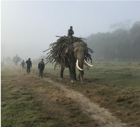
Elefanter som går tillbaka till sitt hägn i Sauraha.

omgivning där vi bodde. Här fanns ett skolområde där nya guider utbildades och på dess område var växterna namnsatta så man kunde promenera runt och lära sig arterna på latin. Under skolbyggnadernas tak hängde bin i stora klasar. Tio Bluebearded Bee-eater och 30-tal Green Bee-eater svärmade runt och födosökte och gav oss möjlighet att njuta och studera dem på nära håll. Här var Lundsångare och Tajgasångare vanliga. Tajgasångare och Bergtajgasångare noterades också. Andra fåglar vi såg var Verditer Flycatcher och Crimson Sunbird. På gräsängen utanför såg vi tre Större Piplärkor.