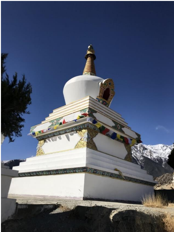
Katsapterenga Gompa. En helig byggnad av flera på området.

Nu hade vi templet inom räckhåll och på vägen upp såg vi och hörde en Berghöna. Väl framme