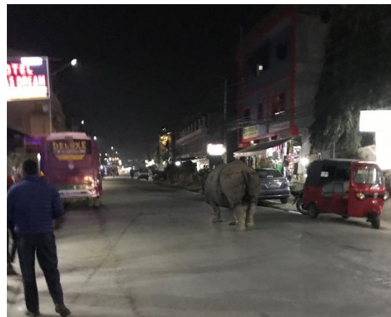
Noshörning som spatserar mitt på huvudgatan i Sauraha.

piplärkor, svalor, vadare, olika småfåglar till Tofsbivråkar som flög runt över trädtopparna. Vile man så hade man möjlighet att gå och äta inom promenadavstånd från området. Det finns ett rikt utbud med restauranger i samhället för att det är här man bor när man ska på guidad tur in i nationalparken. Efter att vi ätit middag på vår restaurang gick vi längs huvudgatan i byn och märkte helt plötsligt en uppståndelse längre fram på gatan. Någon pratade om att det går en noshörning där framme och vi tyckte att det lät osannolikt, - det kan ju inte gå en noshörning mitt på gatan med massa restauranger och affärer tänkte vi.