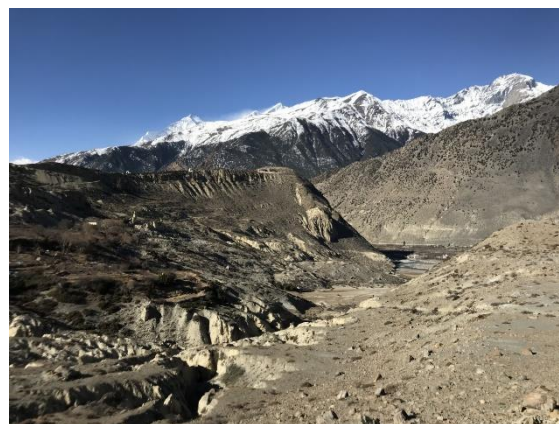
Katsapterenga Gompa skymtar fram på bergskammen.

buskar såg vi 1 Brown Accentor, 10 svarthalsade trastar och 1 vacker hane Rödhalsad trast. Efter dem arterna blev man nästan frisk. Tornfalk, Sparvhök och Korp gladde vi oss åt när de flög över oss när vi gick i en uttorkad biflod. Kallt, torrt och kargt landskap gjorde att det var en speciell känsla när vi gick här, Himalayakänsla. En bit