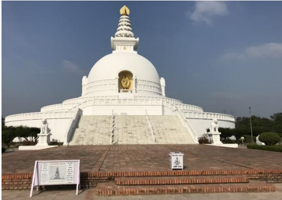
World Peace Pagoda.

Sunbird och ca 800 Lesser Whistling-ducks. Värt att nämna är att vi såg 2 Sarus Cranes i ett litet reservat vid World Peace Pagoda.