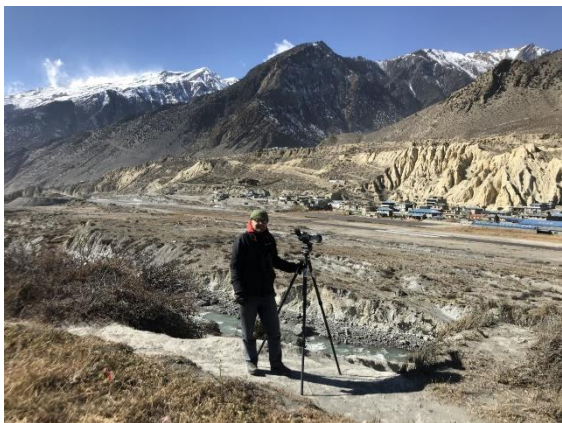
Floden, flygbanan och Jomsom i bakgrunden.

rinner en flod och huvuddelen av Jomsom ligger på den ena sidan och på den andra sidan ligger odlingarna. Efter att ha ätit en grötfrukost med rostad macka och kaffe gav vi oss ut i omgivningarna på andra sidan floden. Omgivningarna bestod även här av äppelodlingar med insprängda plättar av grödor för vardagsbehov såsom någon mangoldliknande växt. Vi fick gå över en