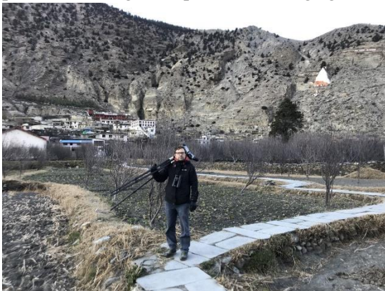
Gick mycket på stigarna i äppelodlingarna. Marpha i bakgrunden.

Bussfärden var i sig väldigt minnesvärd för dess guppighet. Vägen var så hålig och ojämn att vi studsade upp från sätet och slog i huvudet i bagagehyllan och i fönstret flera gånger. Vi tröstade oss med att landskapet var fantastiskt vackert. Väl framme i Marpha var det flera minusgrader. Vi tog in på ett litet käckt hotell precis i början av byn. Sedan gick vi ut i omgivningen, för Marpha var promenadvänligt. Marphas befolkning ägnar