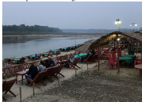
Restaurangområde med utsikt över floden Rapti. På andra sidan ser man Chitwan NP.

njöt av Nepals fågelarter, den behagliga temperaturen (runt 20 grader), insikten av att vi var lediga och att vi var i Nepal. Helt plötsligt satte sig tolv gröna duvor i trädet framför oss. Tubade in dem och vi fick Yellow-footed Green Pigeon att titta på i tubkikaren. Kul, så vackra duvor har vi inte i Europa. Innan vi bestämde oss för att gå tillbaka för lunch hann vi se Sibirisk piplärka, Större piplärka, Long-tailed Shrike, Grey Backed Shrike, Green Bee-eater, Himalayan Swiftlet, Himalayan Goldenback och en flock med Oriental White-Eye. Vi beställde vegetariska rätter för de hade så goda linsgrytor. Promenerade i en park och tittade lite på småfåglar som bland annat Lundsångare, och Common Iora. Gick hem igen för att duscha och förbereda oss för att gå ut och promenera lite i byn. Kom ner till Rapti river där det finns restauranger med utsikt över floden och dess flodbankar. Vi stod och skojade med varandra om gårdagens noshörning, - tänk om noshörningen kommer nu och går upp här som igår. Med detta sagt så gick vi upp till restaurangens terrassliknande överdel med kanonfin utsikt över allt som hände nedanför och beställde in en lokal öl till mig och ett glas rött vin till Helena. Här satt vi säkra och njöt av skymningen och den vackra naturen runtomkring, men ingen noshörning dök upp. Efter att vi konstaterat att vi haft en fin skymning och framförallt en fin skådardag gick vi hem och såg fram emot jeepsafarin i nationalparken nästa dag.