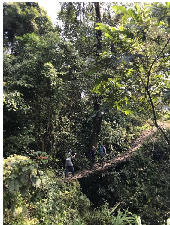
Skådning med två guider i buffertzonen.

Vi gick in i zonen över en gångbro och redan vid första träden såg vi en ung Brun törnskata. Riktigt kul! Det visade sig vara en fullträff.