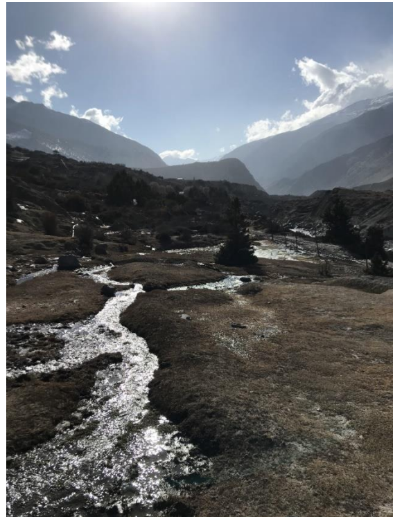
Område med källor som sipprar fram från jorden som dessutom var fågelrikt.

hela dalen och dess flod. Man såg även Marpha längre nedströms. Vi satte oss i lä av en mur och plockade fram vårt mellanmål som bestod av torkade äppleskivor, nötter, chokladkaka och en läsk. Framför oss hade vi en fin utsikt. Solen sken och mitt i vår måltid dök en ung Lammgam upp och gled över våra huvuden. Fantastiskt roligt att se en elegant gam så nära. Innan tillbakagång såg vi flera av både Himalayan och Griffon Vultures samt en Grågam väldigt nära oss uppburna av uppåtvindarna som skapades här. Härifrån tog vi vägen genom Thini village som är en vacker by på en sluttning ovanför Jomsom. Vi slank in på den lokala restaurangen och åt pasta och stekta grönsaker med ketchup tillagade av ägaren själv, för kocken var iväg någon annan stans. I odlingarna mellan Thini village och Jomsom såg vi 10 Beautiful Rosefinch, 2 honor Streaked Rosefinch, 2 Grey-backed Shrike, flertalet Large-billed Crow. Anmärkningsvärt sågs 2 Rörhöns bland några buskar bredvid en undervattenkälla som sipprar ut ur en gräsmatteliknande äng mellan buskagen.