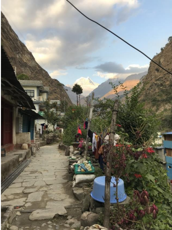
Bygatan i Tatopani.

och precis som namnet säger har den en stor näbb. Kråkan börjar ses från dessa höjder. Himalayan Bulbul, Grey-hooded Warbler och Black-lored Tit såg vi precis i anslutning till hotellets entré. Bergsväggarna är så branta här så om man vill promenera runt så måste man hålla sig längs bilvägen, vilket kändes något tråkigt. I hotellets restaurang lärde vi känna