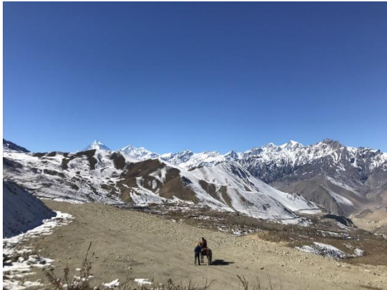
Vyn från busshållplatsen i Muktinath.

flera minusgrader. Vi skulle till Muktinath, ett tempelområde på 3800 meters höjd. Det är ett heligt område dit många buddhister och hinduer vallfärdar på grund av att vattnet, elden och jorden förenas där. Efter att ha gått igenom byn och klättrat uppför några långa och branta trappor så var man framme vid det heliga tempelområdet. Det var minus 10 grader, bitande kallt alltså. Här fanns inte många fåglar att titta på tyvärr. Spanade dock med tuben efter Himalayan Snowcock och Snow Pigeon men utan framgång. Tillbaka vid