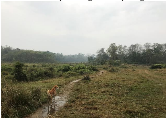
Gräsängarna vid ån i Sauraha där vi gick dagligen.

Vi gick upp tidigt, ivriga att gå till ån och dess gräsmarker. Vi stod ute vid entrén redo att lämna vårt hotell när Helena säger titta!! där går en noshörning på gatan utanför. Och visst gick där en noshörning, antagligen ner till ån efter att ha ätit på fälten bakom byn. Ojdå, tänkte vi en noshörning till. Det här kan ju inte vara normalt, var min spontana tanke. Inte någonstans hade jag hört eller läst om detta. Vår värd berättade senare att det rörde sig om en individ som mobbas av de övriga noshörningarna i nationalparken. Den söker sig därför till odlade fält runt samhället för att äta potatis, och olika sädesslag, eller ner till ån och dess omgivning där de andra noshörningarna inte går. Idag började vi vid floden Rapti, som ån mynnar ut i. Vi tog oss tid och skådade i lugnt tempo. Flockar med Roständer födosökte. Darter, Little Cormorant och tre arter med kungsfiskare som fiskade var trevliga inslag. Vi spanade ut över till andra sidan Rapti river för att försöka se tiger men såg bara vackra påfåglar och insåg att vi inte hade samma tur som med noshörningar. Dock såg vi några krokodiler innan vi började gå uppströms ån. Citronärta sågs och hördes vid ån. Vi såg flera arter som Asian Openbill, Indian Pond Heron, Grey Headed Lapwing, White Breasted Waterhen, Brown Crake, White browed Wagtail, Sädesärlor av underarten leucopsis. Vi gick runt på stigarna,