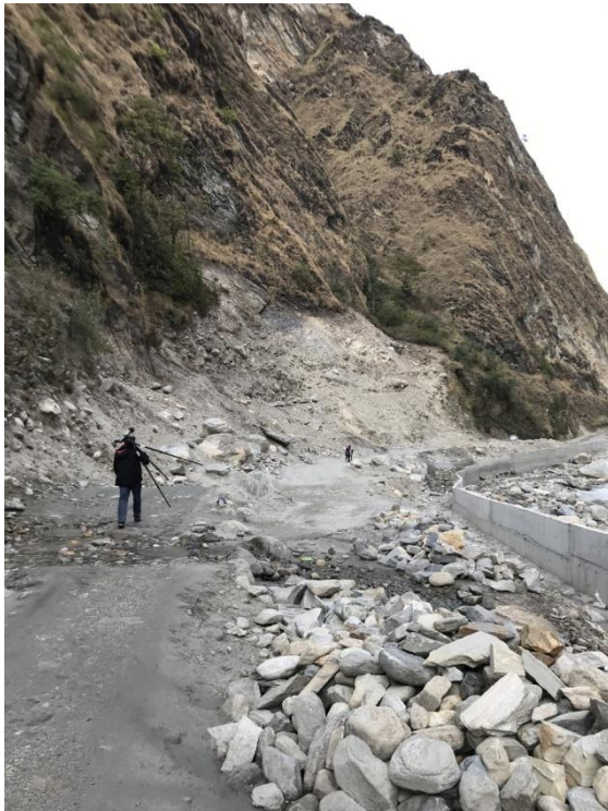
Vägen som leder ut från Tatopani upp till Marpha.

och precis som namnet säger har den en stor näbb. Kråkan börjar ses från dessa höjder. Himalayan Bulbul, Grey-hooded Warbler och Black-lored Tit såg vi precis i anslutning till hotellets entré. Bergsväggarna är så branta här så om man vill promenera runt så måste man hålla sig längs bilvägen, vilket kändes något tråkigt. I hotellets restaurang lärde vi känna