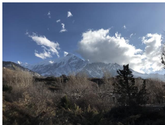
Skogsdungen i Jomsom som vi besökte dagligen.

Idag bestämde vi oss för att gå upp till Katsapterenga Gompa (tempel) via sjön Dhumba tal och tillbaka via Thini village. Vi var fortfarande förkylda, snoriga och nu dessutom påverkade av höjden genom att känna av en lätt huvudvärk men vi kämpade ändå på i uppförsbacken. I en skogsdunge med