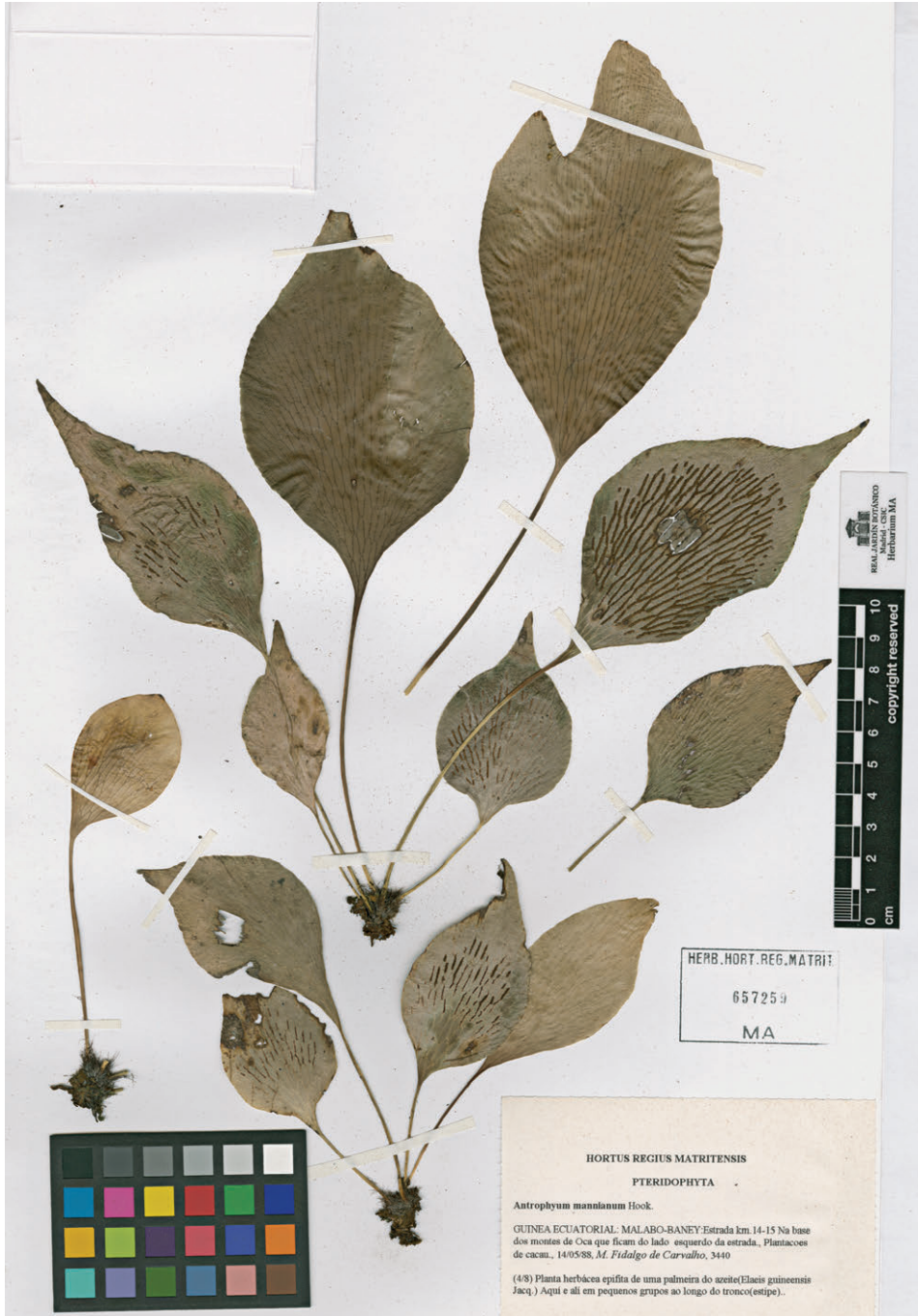
Fig. 225. Antrophyum mannianum