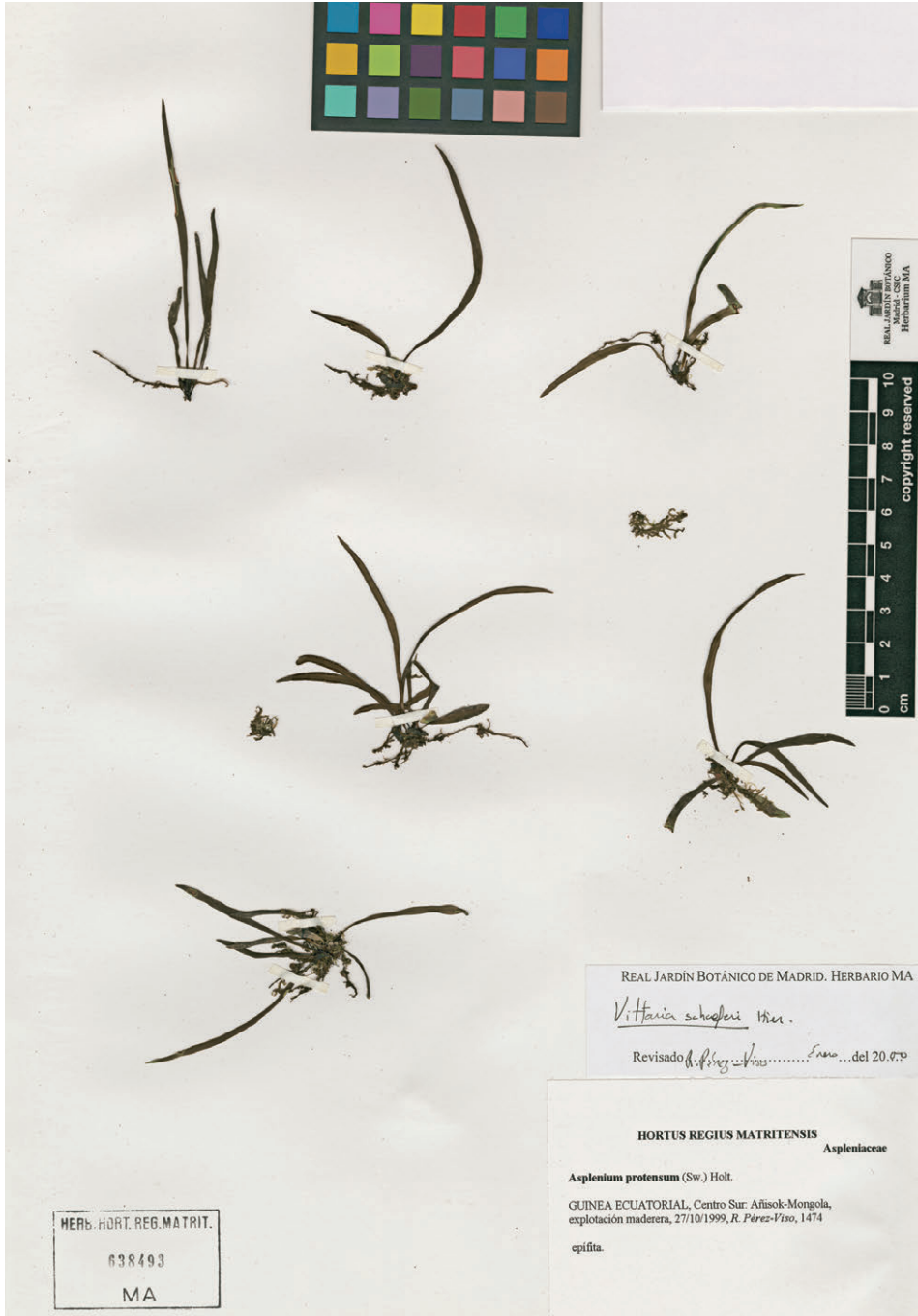
Fig. 227. Vittaria schaeferi