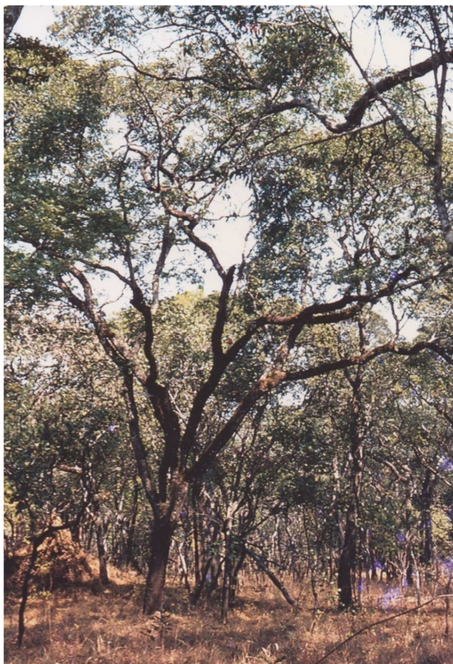
Photo1.- Forêt claire intacte de type miombo humide © François MALAISSE, Luiswishi, juillet 1972.

domestiques et les petites entreprises (MALAISSE 1977, MEGEVAND et al., 2013). D'une population qui est passée de près de 6.000 habitants en 1911 (DIBWE, 2009) à plus de deux millions en 2015 (United Nations, 2016). BRUNEAU & PAIN (1990) et MALAISSE & BINZANGI (1985) estimaient, pour leur part, qu'en 1985 le rayon de l'aurole de déforestation avançait, en moyenne, de 1,4 km par an.