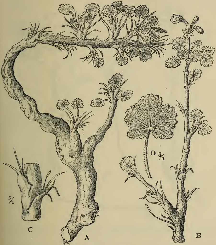
Fig. 4. Pelargonium damarense R. Knuth. A ganze Pflanze, B junger Sproß, C Zweigstück mit Blattscheiden und verdorrten Blattstielen, D Blattspreite. — Original.

P. graniticum R. Knuth, n. sp. — Caudex 5—7 cm longus, \pm tortuosus, 3—8 mm crassus, cortice fusco papyraceo obtectus, superne \pm furcatus ramulis brevibus, \pm verticalis, inferne elongatus in corpus stoloideo usque 7 cm longum 1 mm crassum tuber unum gerens; tuber rotundatum 8—15 mm crassum sublignoso-carnosum, cortice atro-fusco