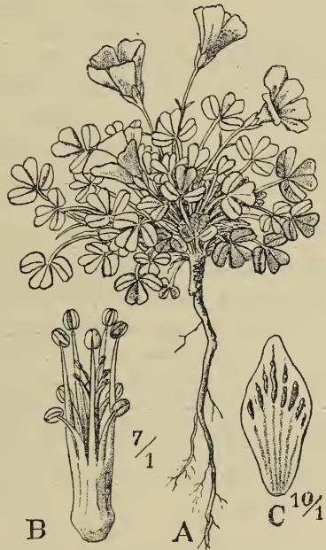
Fig. 3. Oxalis ausensis R. Knuth. A Ganze Pflanze, B Andröceum und Gynäceum, C Kelchblatt. — Original.

Oxalis ausensis R. Knuth, n. sp. — Pusilla, acaulis, usque 3 cm alta. Radix \pm verticalis, pallide fusca, circ. 4 mm crassa, 5 cm et ultra longa, radicularibus sparsim obsita. Folia basalia, numerosa, 12—25, glabra, trifoliolata; foliolium medium cuneato-obcordatum, margine antico parum incisum, 5 mm longum, 3\frac{1}{2} —4 mm latum; lateralia obliqua, non raro \pm minora; omnia glaucoideo-viridia, crassiuscula, margine antico \pm glandulis obsita; petiolus filiformis, 1— 2\frac{3}{4} mm longus, vix strictus. Flores folia excedentes, rarius eis aequilongi. Pedunculi basales, 1\frac{1}{2} cm longi, filiformes, erecti, glabri, bracteis 2 oppositis setaceis 1— 1\frac{3}{4} mm longis supra medium obsiti. Sepala 2 mm longa, late ovata, obtusa, apice glandulis pluribus rubris liniformibus notata. Petala sepalis 4—5-plo longiora, circ. 7—8 mm longa, lutea, \pm cuneata, margine anteriore retusa vel repando-sinuata. Stamina interiora sepalis longiora; exteriora interioribus 2-plo breviora; omnia sicut styli glabra. — Fig. 3.